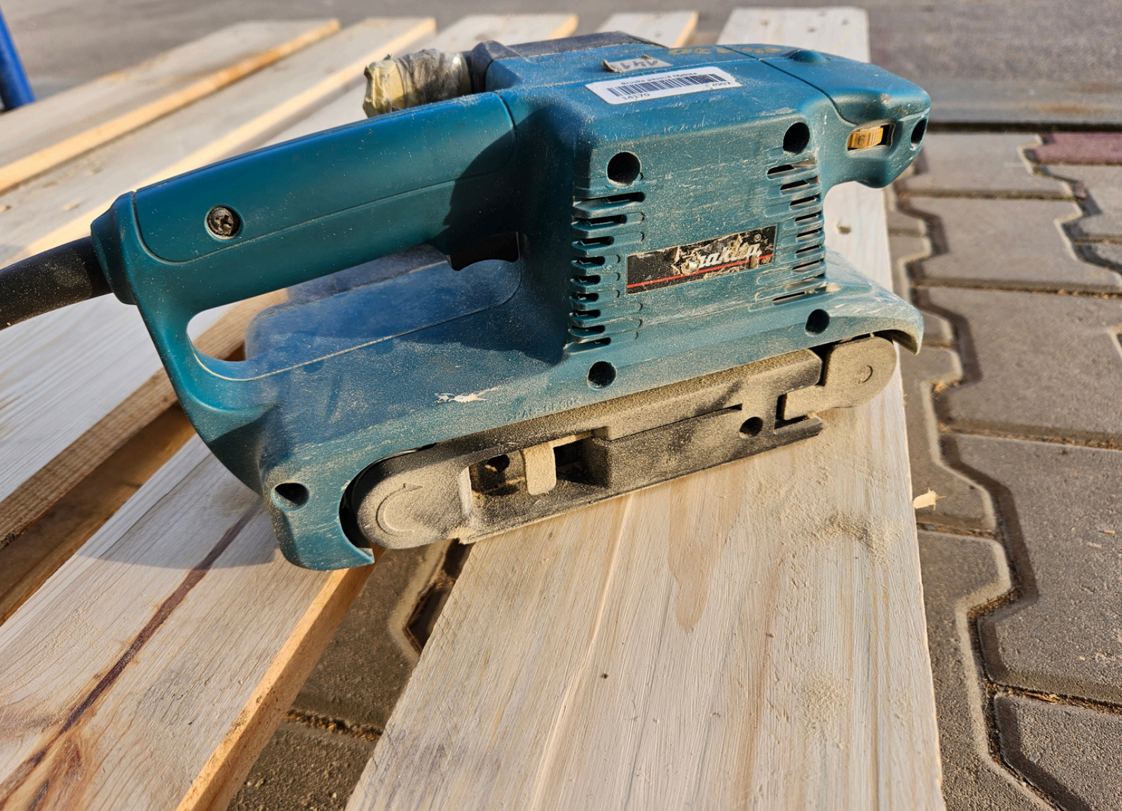
Obr. 11, 12, 13, 14, 15 - Broušení, broušení a broušení...