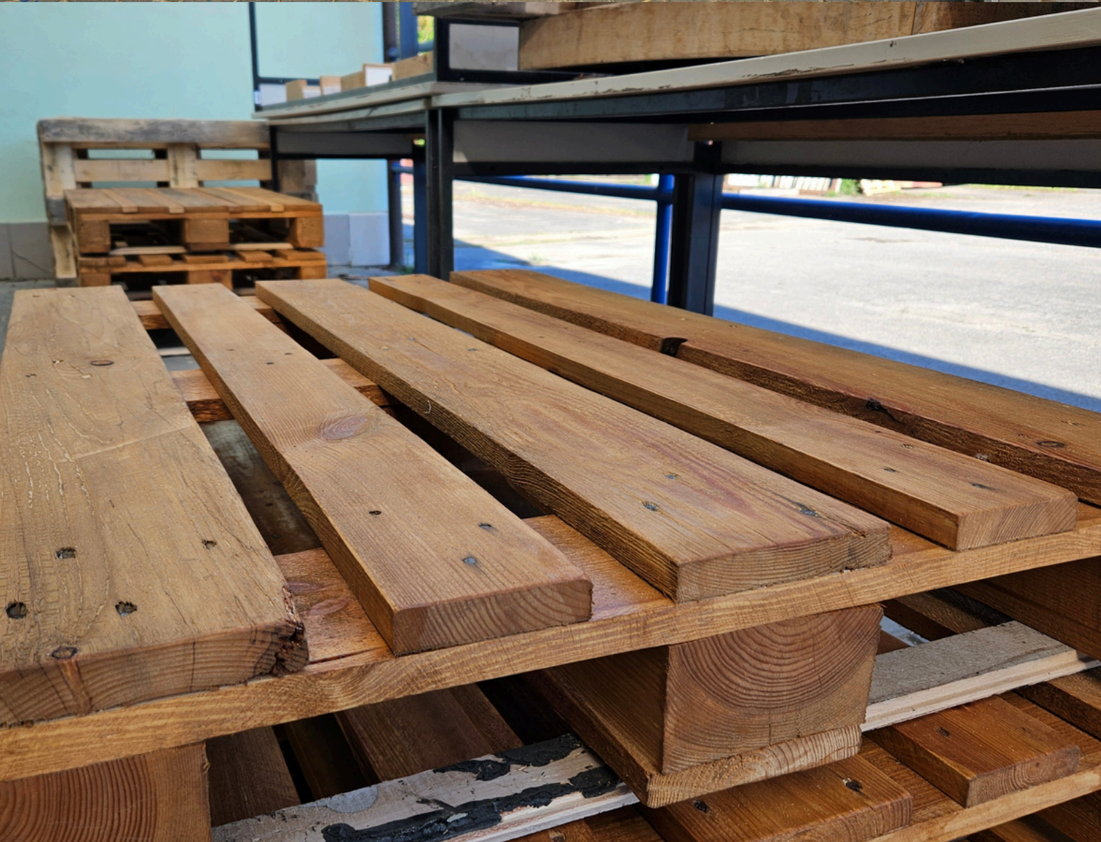
Obr. 26, 27 - Doba schnutí jednoho nátěru byla mezi 8 až 12 hodinami (záleželo na tom, jak moc velkým množstvím byla paleta natřena). Celkově bylo natřeno 26 palet, které se přeměnily v 6 laviček a 2 stoly.