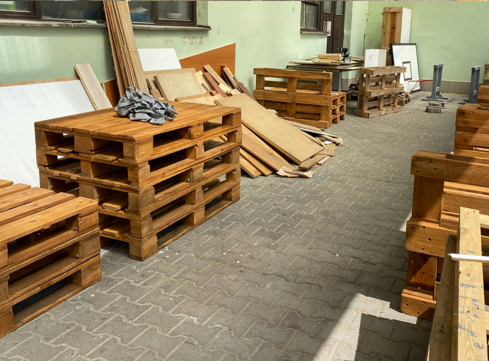
Obr. 30, 31, 32, 33, 34 - Nově smontované palety čekají na odvoz ke svému staronovému majiteli - Papírny Brno na Křenové, ale ještě předtím navštíví sklad na Mlýnské.