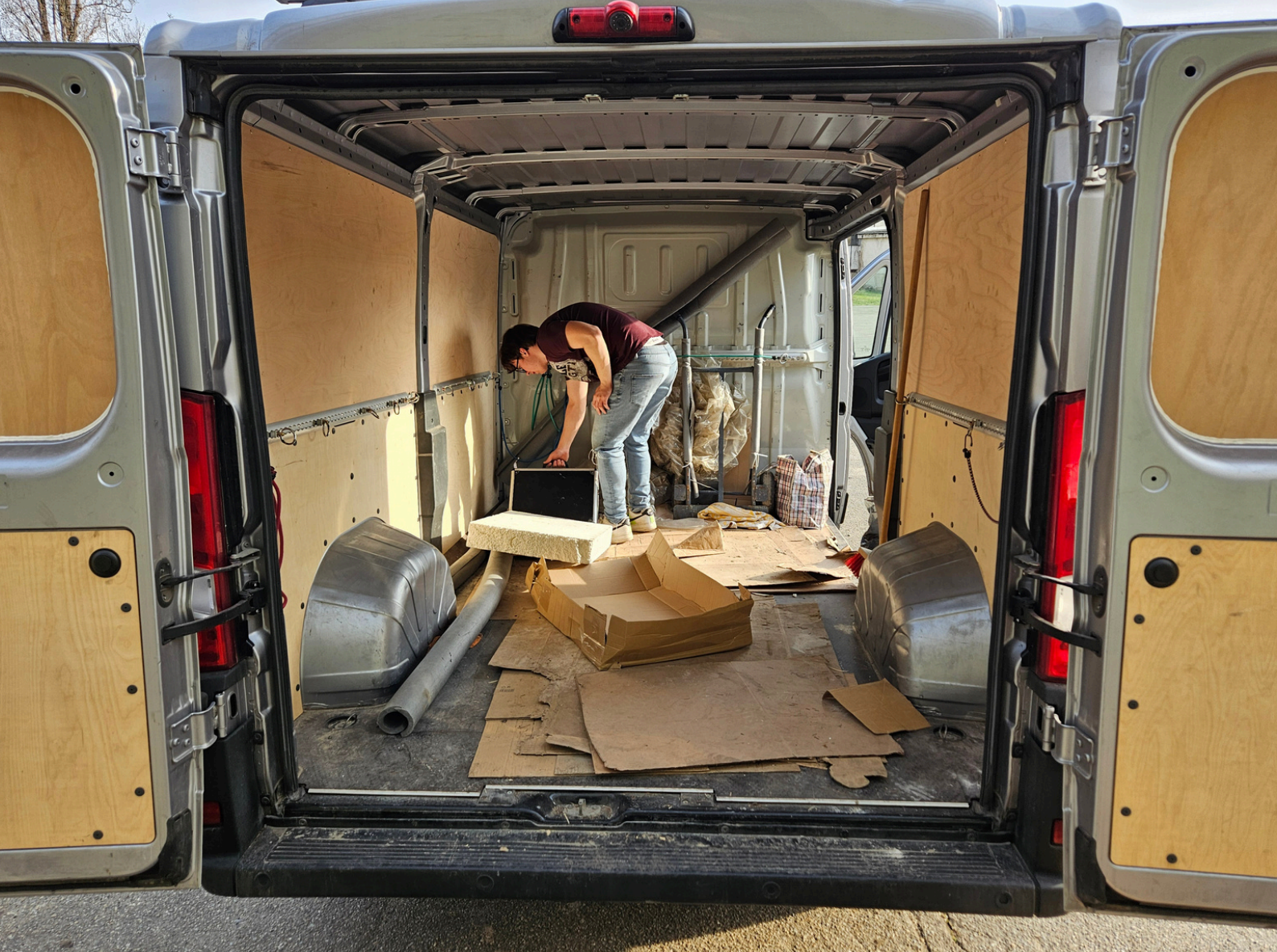
Obr. 6,7,8,9 - Vykládka palet na dislokaci Jahodová.