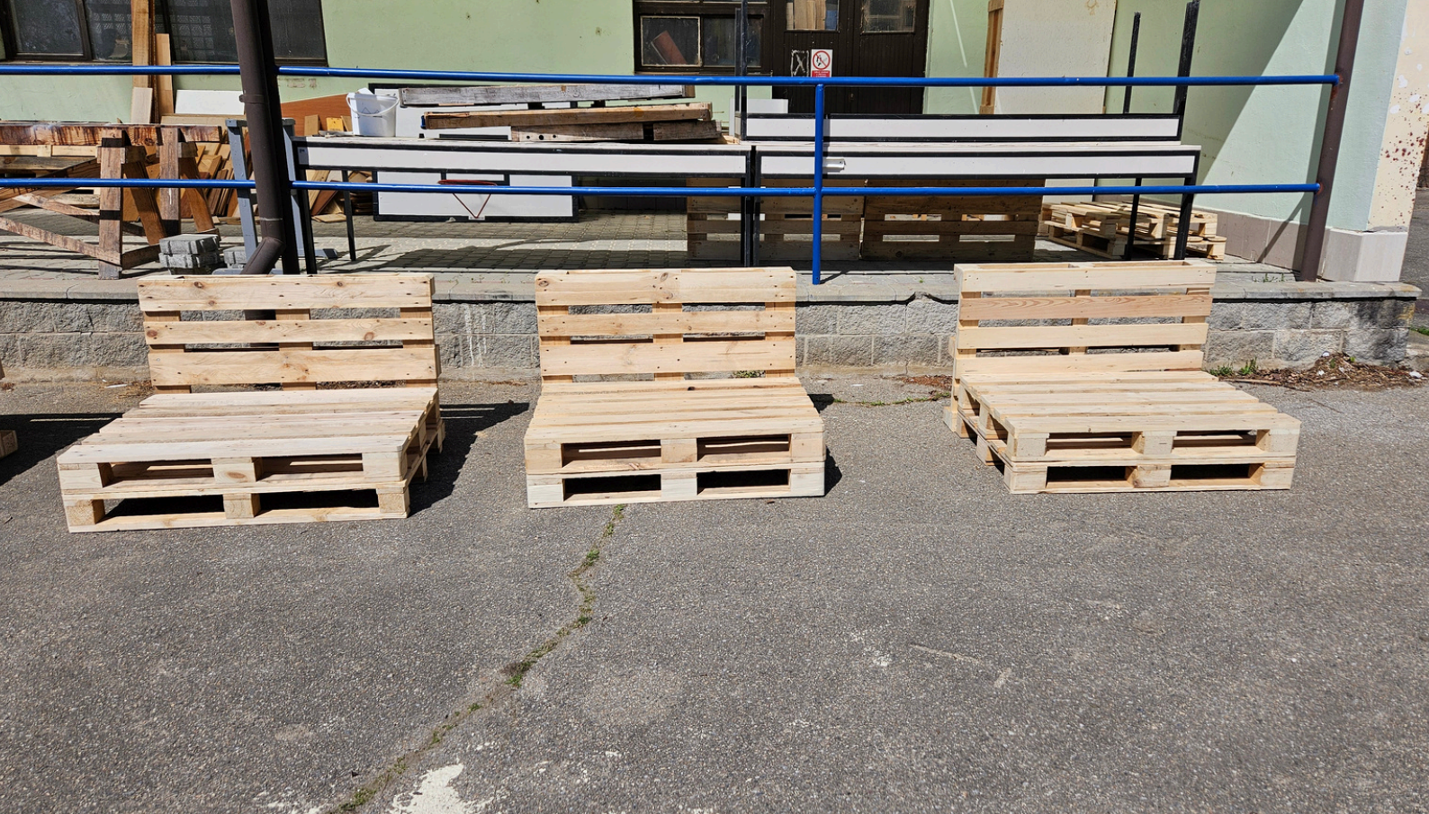
Obr. 16, 17 - Kompletace nanečisto, kdy jsme si vyzkoušeli v praxi dva různé designy paletového posezení - 3 palety o výšce o 3 palet, 3 palety o výšce 2 palet. Stoly budou také řešeny "půl na půl", kdy jeden stůl bude vysoký 3 palety, druhý vysoký 2 palety.