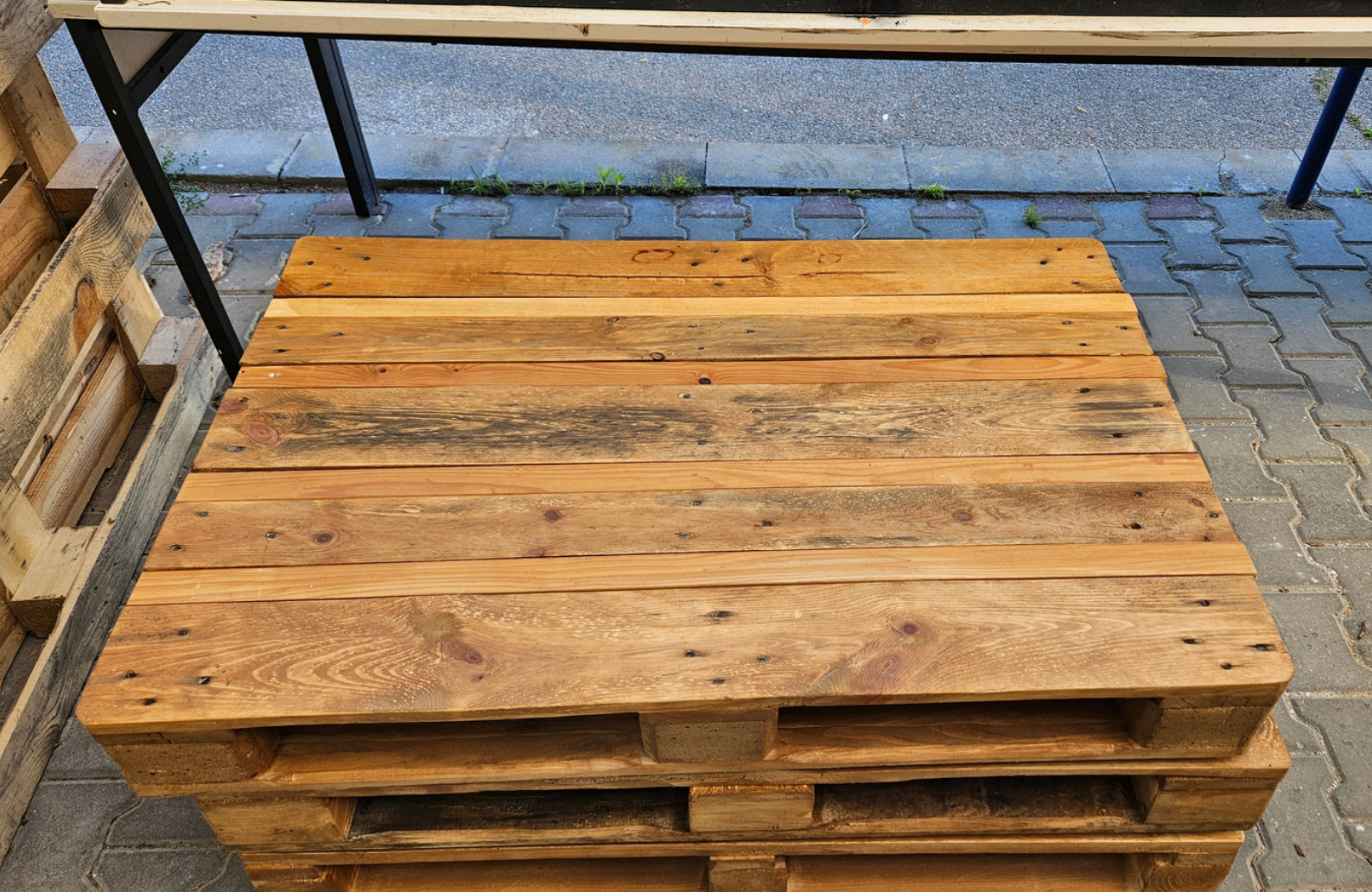
Obr. 28 - Detailní pohled na stoly, přesněji pohledové kusy, na které se budou odkládat věci. Mezery jednotlivými prkny byly vyplněny menšími kusy, které jsme složitě zhoblovali aby se vešly do spár a zařízly na požadovanou délku.