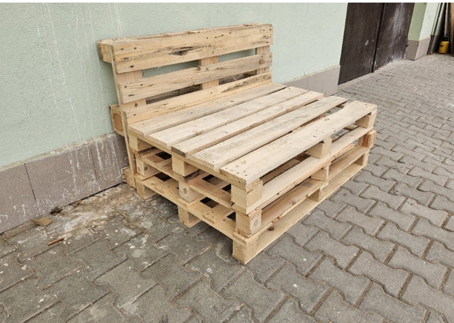
Obr. 2 - Již finální design paletové lavičky (typ s výškou 3 palet) vyzkoušen nanečisto na zkušebních paletách, které byly na dislokaci Jahodová.