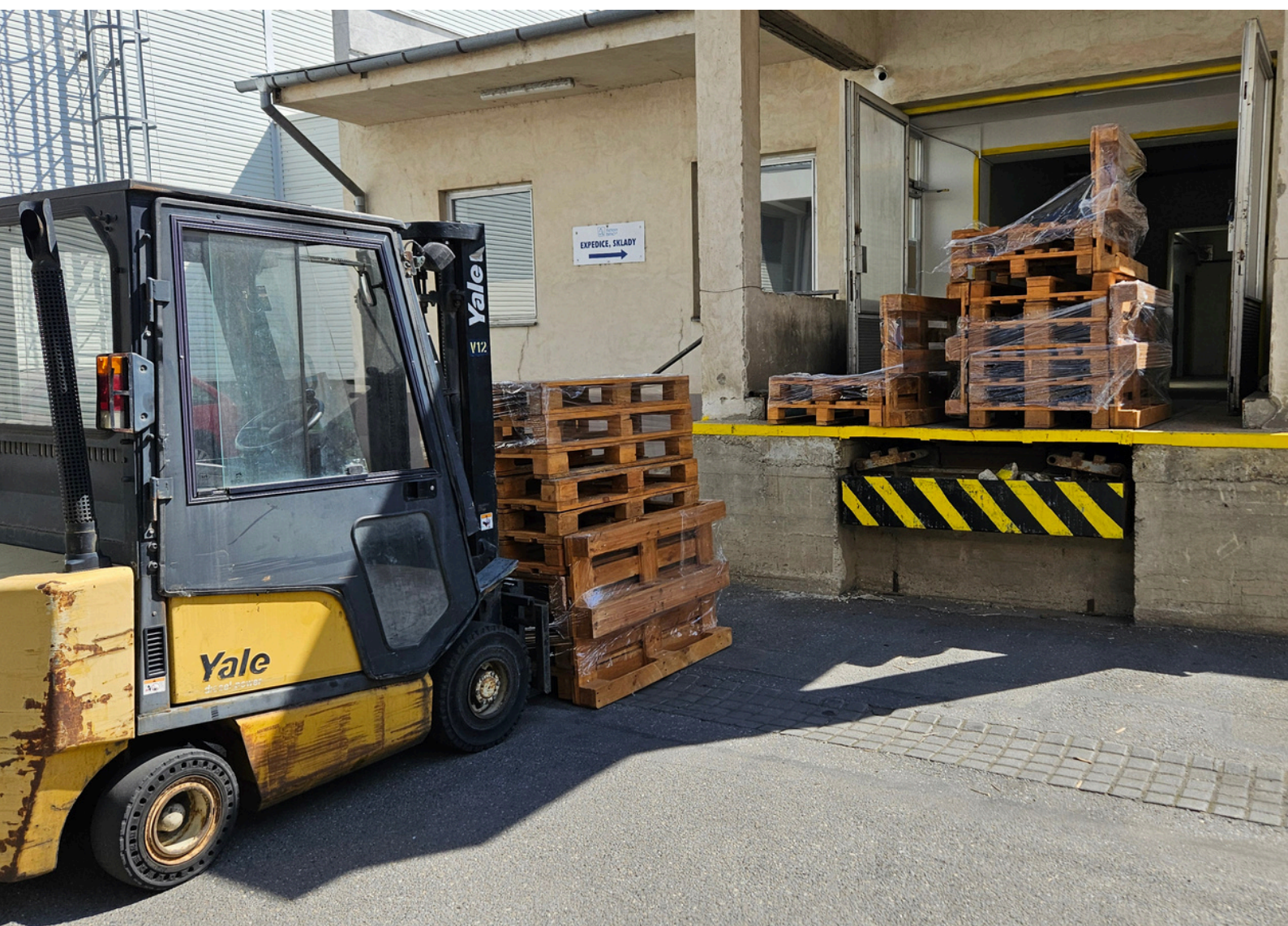
Obr. 39 - A dáme paletám sbohem... Aspoň na pár dní, dokud je slavnostně nepředáme.