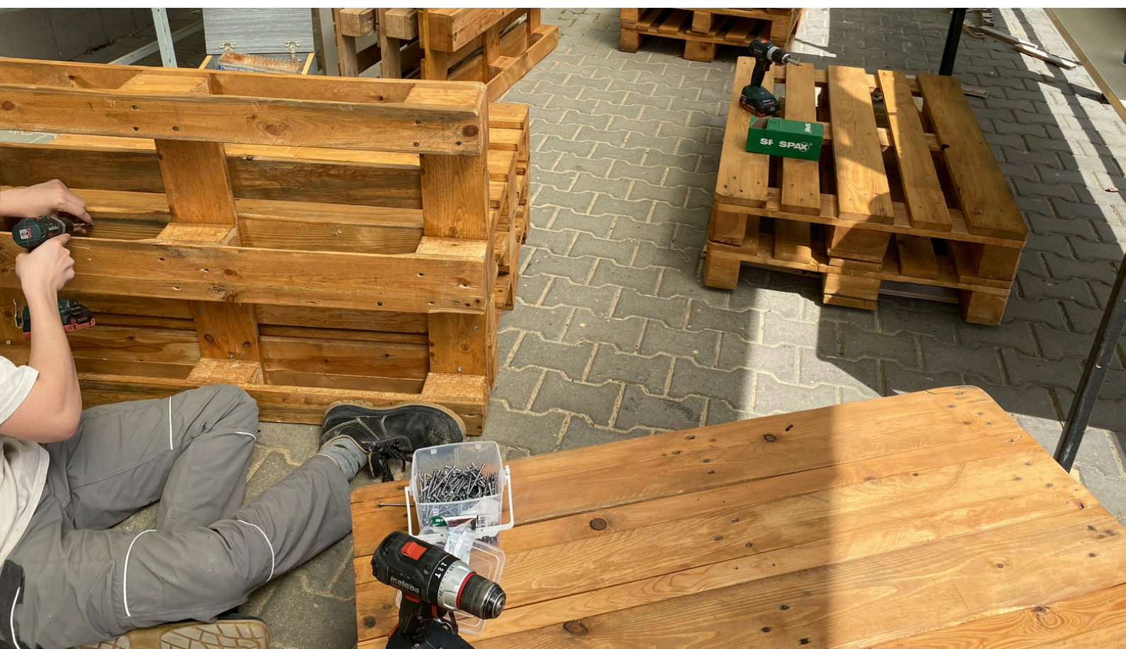
Obr. 29 - Jeden z našich truhlářů zachycen jak montuje menší typ lavičky. Samotná montáž byla nejnepohodlnější částí výroby, což ve většině případů je u každého výrobku.