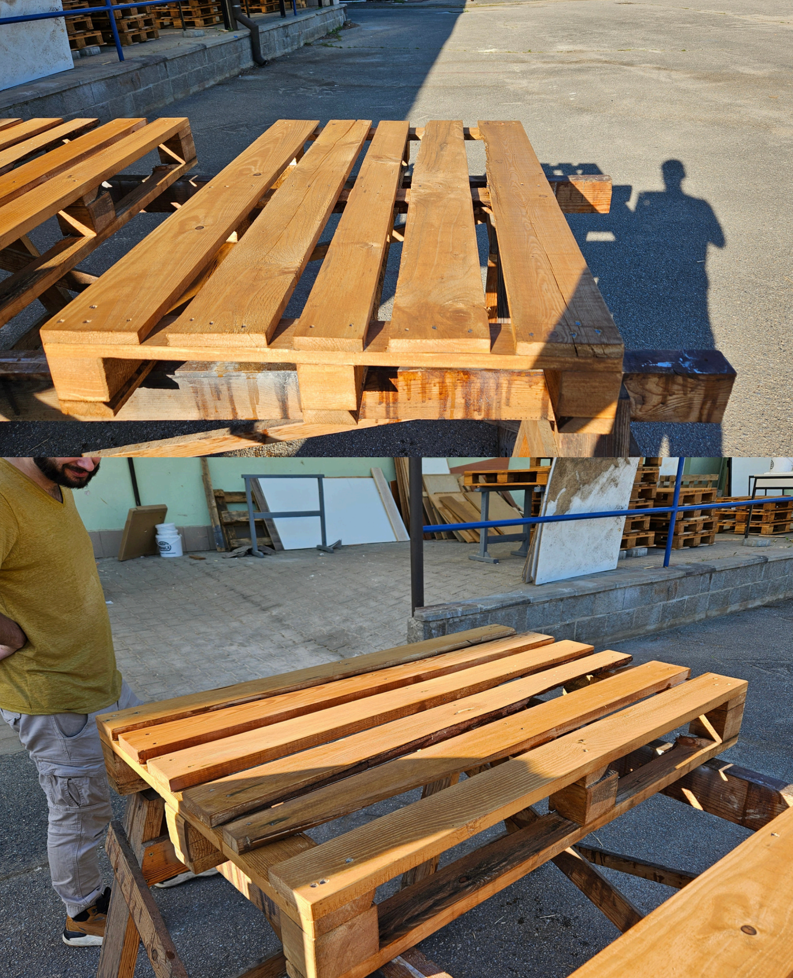
Obr. 18, 19, 20, 21, 22, 23, 24, 25 - Natírání jednotlivých palet. Natíraly se po jednotlivých kusech, abychom měli šanci natřít i méně dostupná místa. Palety jsou natřeny dvěma nátěry olejem OSMO - Modřín a Teak. První nátěr byl v poměru 1:1, druhý pouze Teakovým olejem. Pro větší plochy se využilo Rouno, pro zbytek štětce. Natírání se účastnili i lidé mimo tým, kteří ochotně pomohli a přiložili ruku k dílu. Velké díky!