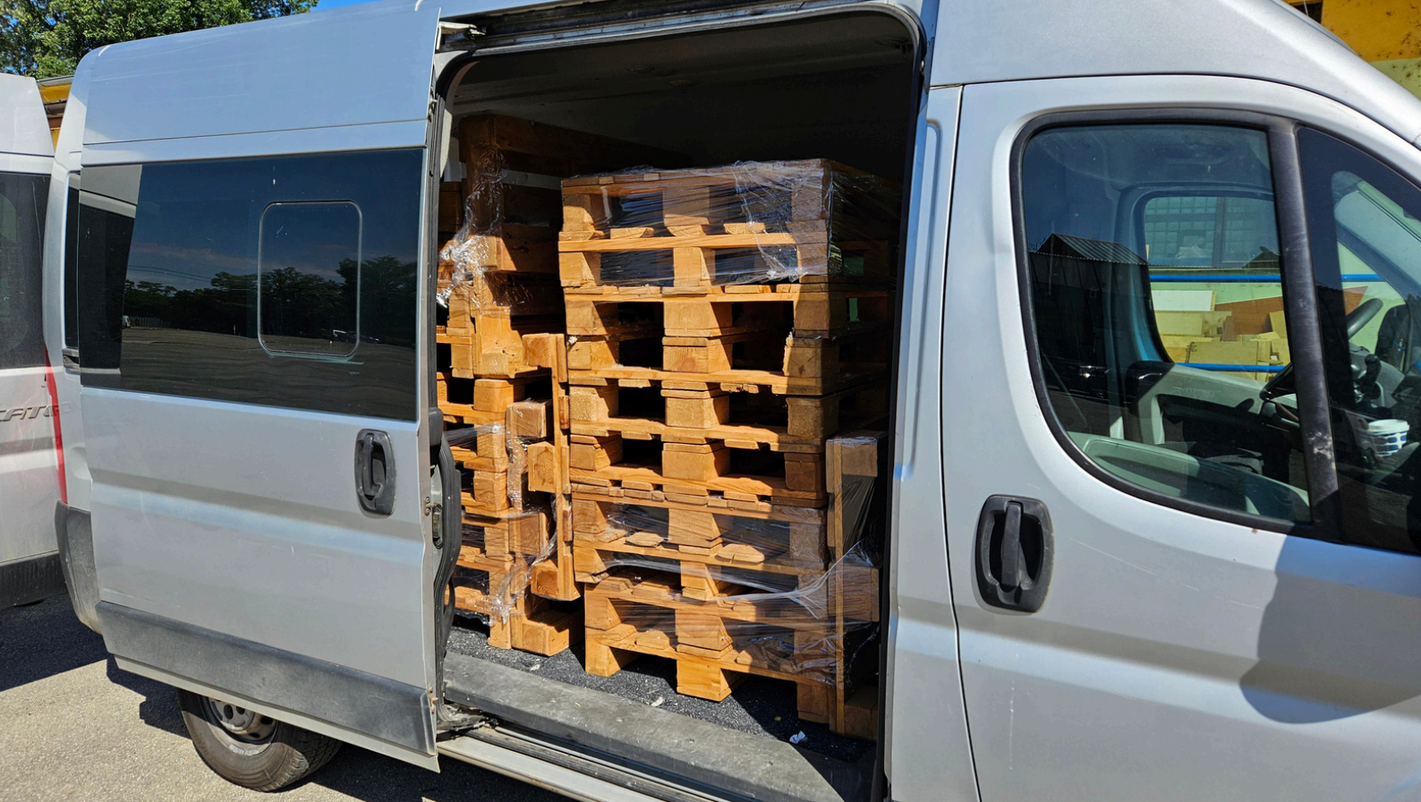
Obr. 35, 36, 37, 38 - Samotná opětovná nakládka byla taková menší hra Tetrisu. Dodnes nechápeme jak, ale povedlo se nám to odvézt na jeden zátah.