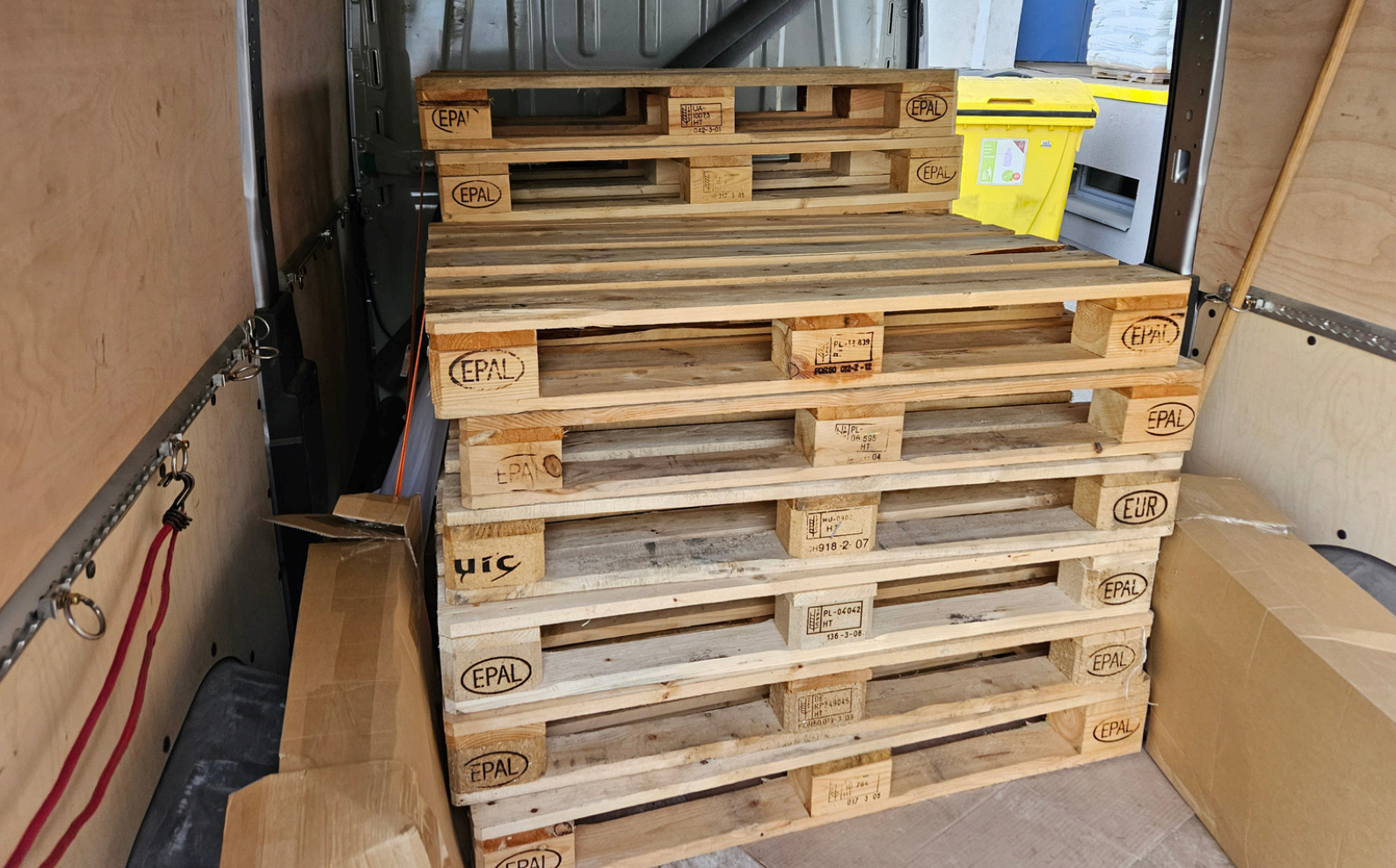
Obr. 3,4,5 - Nakládka palet v areálu Papíren Brno a dovážka směr dislokace Jahodová.