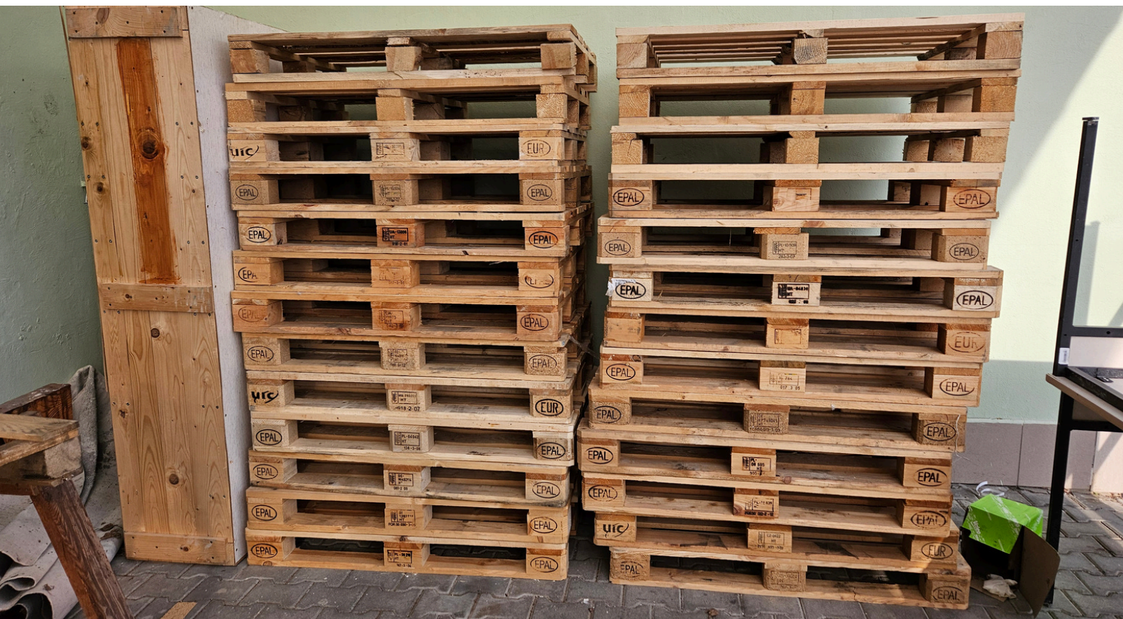
Obr. 10 - Složené palety, které čeká následné přebroušení, nátěr, kompletace a máme zahradní nábytek!